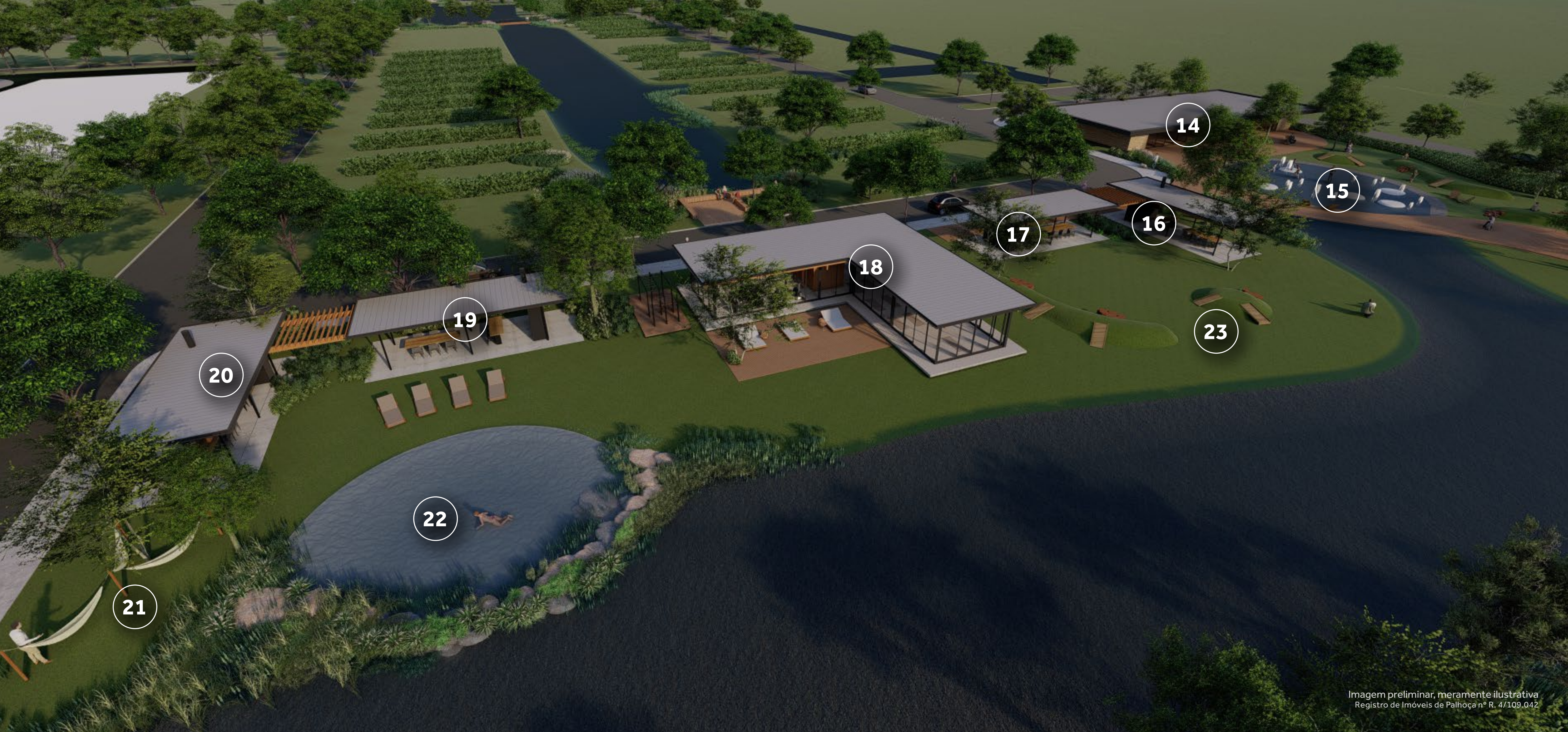
Imagem preliminar, meramente ilustrativa Registro de Imóveis de Palhoça nº R. 4/109.042